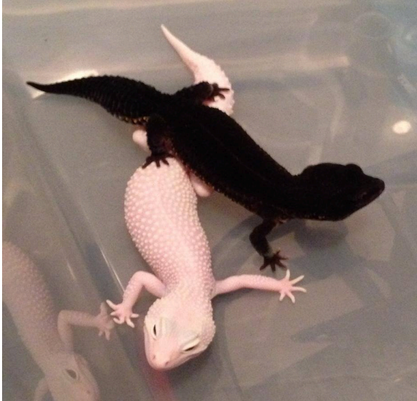
Abbildung 10: Blizzard und Black Night

Der Blizzard ist schneeweiss, wie der Schneesturm der auf Englisch Blizzard heisst. Manchmal sind sie auch gelb und heissen Banana Blizzards. Ab und zu kommt es vor, dass die Blizzards Snake Eyes haben, fast etwas gruselig 😊