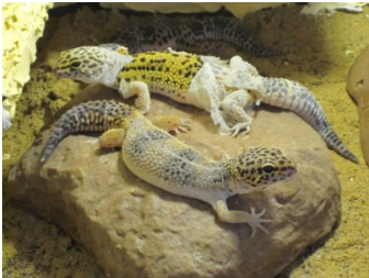
Abbildung 3: Häutung

Damit Reptilien noch in ihre Haut passen, wenn sie wachsen, streifen sie diese alle 4-6 Wochen ab. Das wird Häutung genannt. Die Haut ist nur die ganz dünne Oberhaut und durchsichtig. Du siehst vorher, wenn sich der Leopardgecko häutet, denn er wird blass.