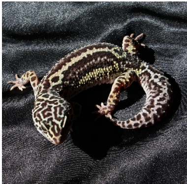
Abbildung 9: Mack Snow Stripe

Der Mack Snow (Schnee) kommt mit einer weissen Grundfarbe auf die Welt, die er langsam verliert. Im Bild hat er bereits die hellgelbe Grundfarbe. Speziell ist auch der ‚Stripe‘, die zwei schwarzen Streifen auf dem Rücken, die es aber bei allen Morphen geben kann. Mack steht übrigens für die Zucht, in der der Snow das erste Mal geschlüpft ist.