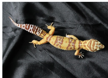
Abbildung 7: Tangerine Albino

Albinos bei den Leopardgeckos nicht weiss mit roten Augen. Oft sind die normalen, schwarzen Zeichnungen (Punkte, Kreise und Linien) hellbraun verblasst. Die meisten Morphe gibt es mit Schwarz und eben ohne Schwarz als Albinos.