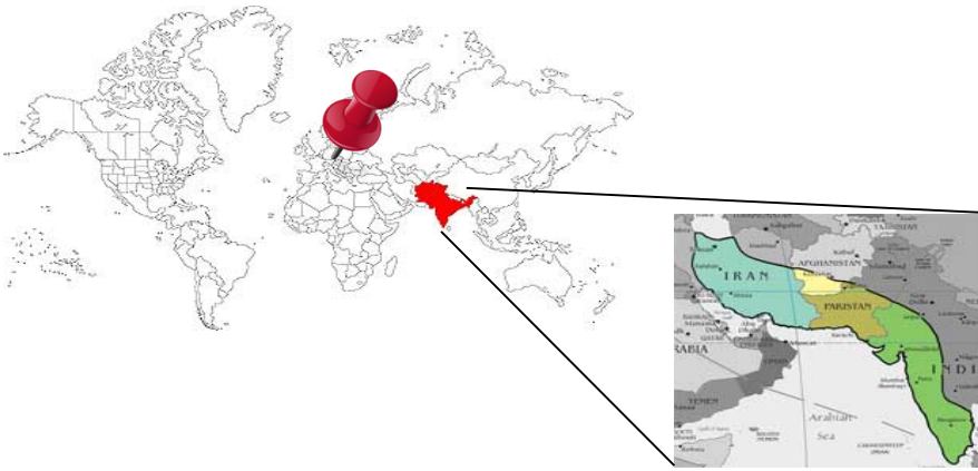
Abbildung 1: Die Heimat des Leopardgeckos und die Schweiz (Pin)

In dieser Region ist es tagsüber sehr heiss und nachts frostig kalt. Daher