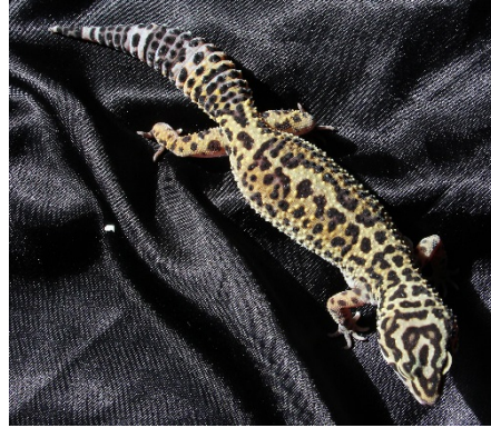
Abbildung 5: Wildfarben

In der Natur kommen die Leopardgeckos mit einem bräunlichen Farbton und schwarzen Punkten vor. Wir nennen sie Wildfarbene . Durch die Zucht und etwas Glück sind in den letzten 30 Jahren neue Morphe entstanden.