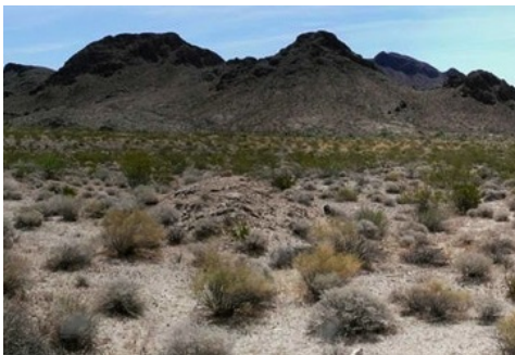
Abbildung 2: Natürlicher Lebensraum

In dieser Region ist es tagsüber sehr heiss und nachts frostig kalt. Daher