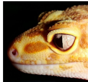
Abbildung 4: Snake Eye