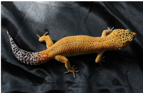
Abbildung 6: Tangerine

nach den High Yellows sind die Tangerines entstanden. Sie haben in der extremen Form keine Punkte mehr auf dem Körper und die Farbe ist fast schon orange.